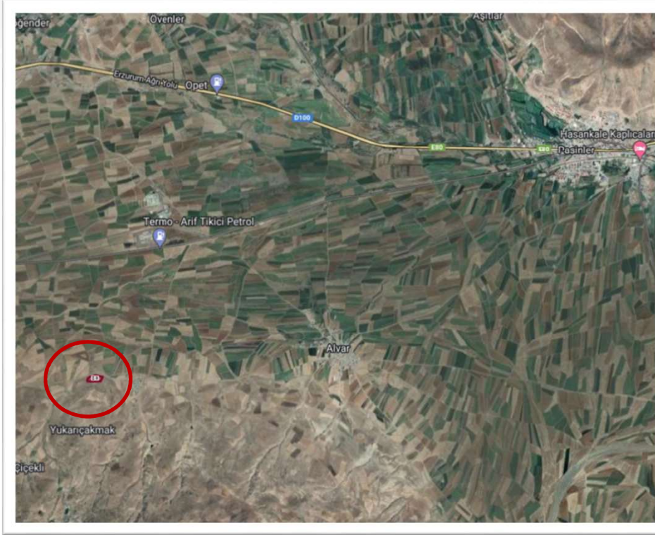
Alanın Uydu Görüntüsü (Uzak)