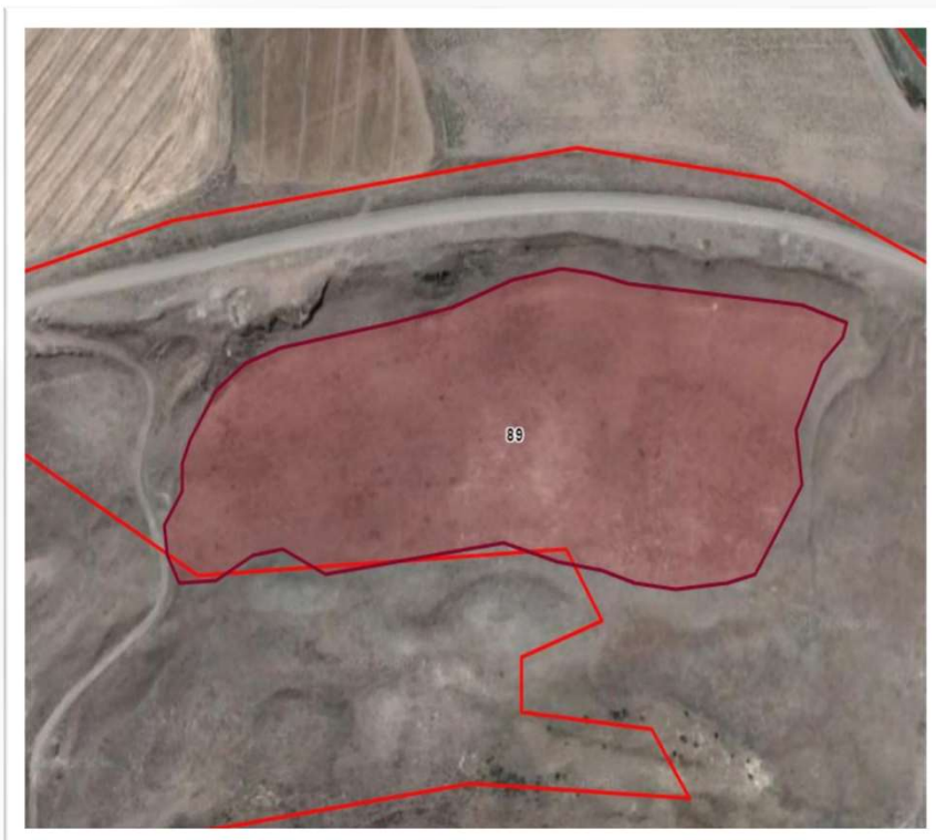
Alanın Uydu Görüntüsü (Yakın)