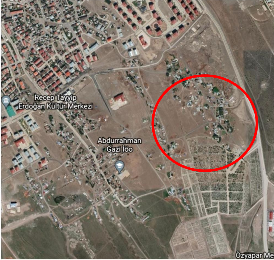
Alanın Uydu Görüntüsü (Uzak)