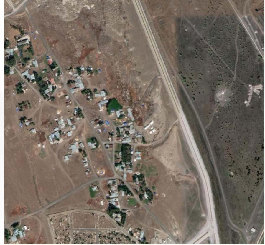
Alanın Uydu Görüntüsü (Yakın)