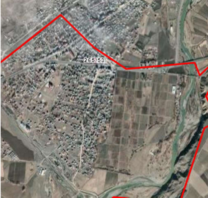
Alanın Uydu Görüntüsü (Uzak)