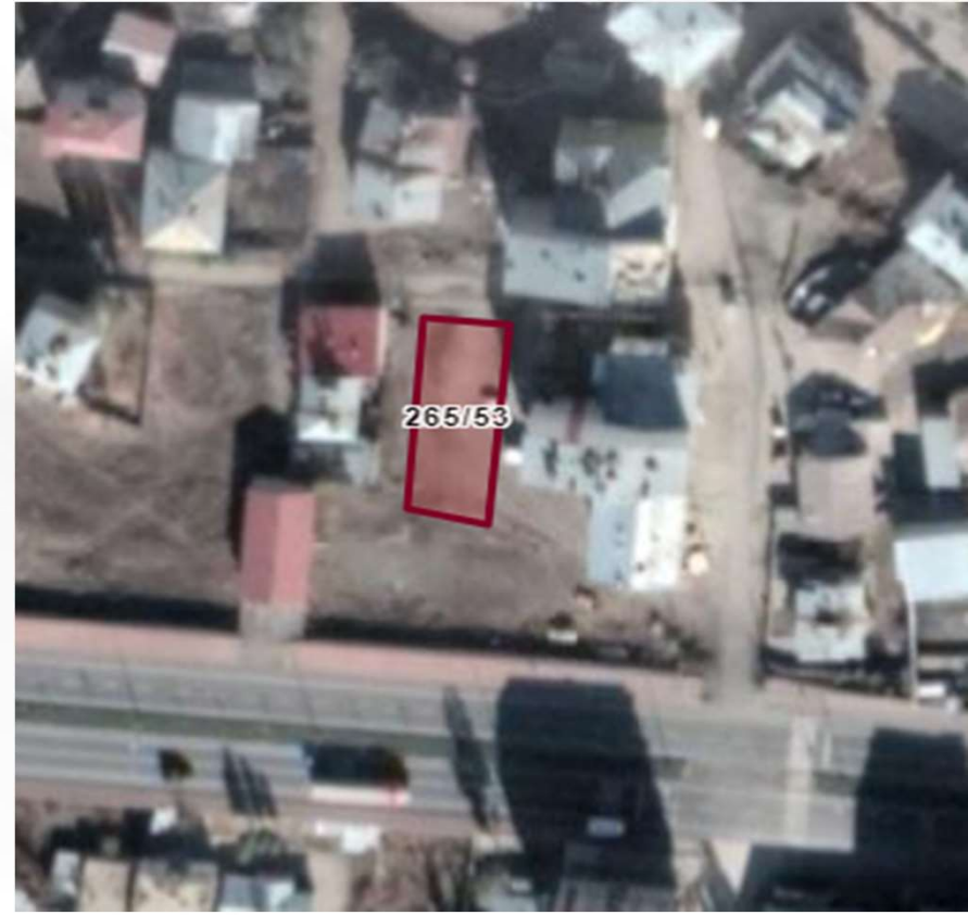
Alanın Uydu Görüntüsü (Yakın)