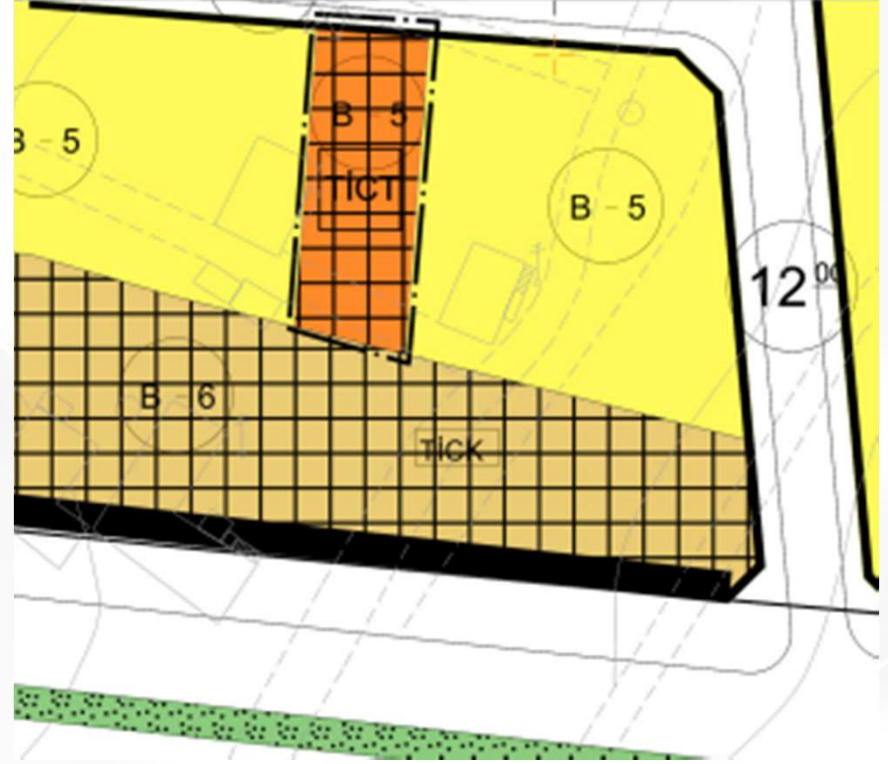
İmar Plan Değişiklik Sonrası Durum 1/1000 Uygulama İmar Planı