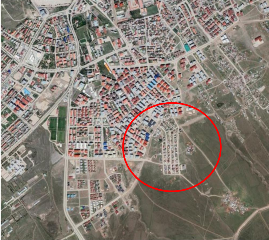
Alanın Uydu Görüntüsü

Erzurum Büyükşehir Belediye Meclisinin 16.05.2019 Tarih 204 Sayılı Meclis Kararıyla Kentsel Dönüşüm ve Gelişim Alanından çıkarılan Palandöken İlçesi, Yunus Emre Mahallesi, Cenk Küme Evler olarak belirtilen alan 1/1000 Uygulama İmar Planlarımızda plansız alan olarak görünmekte olup söz konusu Cenk Küme Evlerde mevcut altyapı, yerleşke dikkate alınarak çevresiyle bir bütün olacak şekilde A-2 Kat TAKS:0.30 KAKS:0.60 Konut Alanı olarak düzenlenmesi