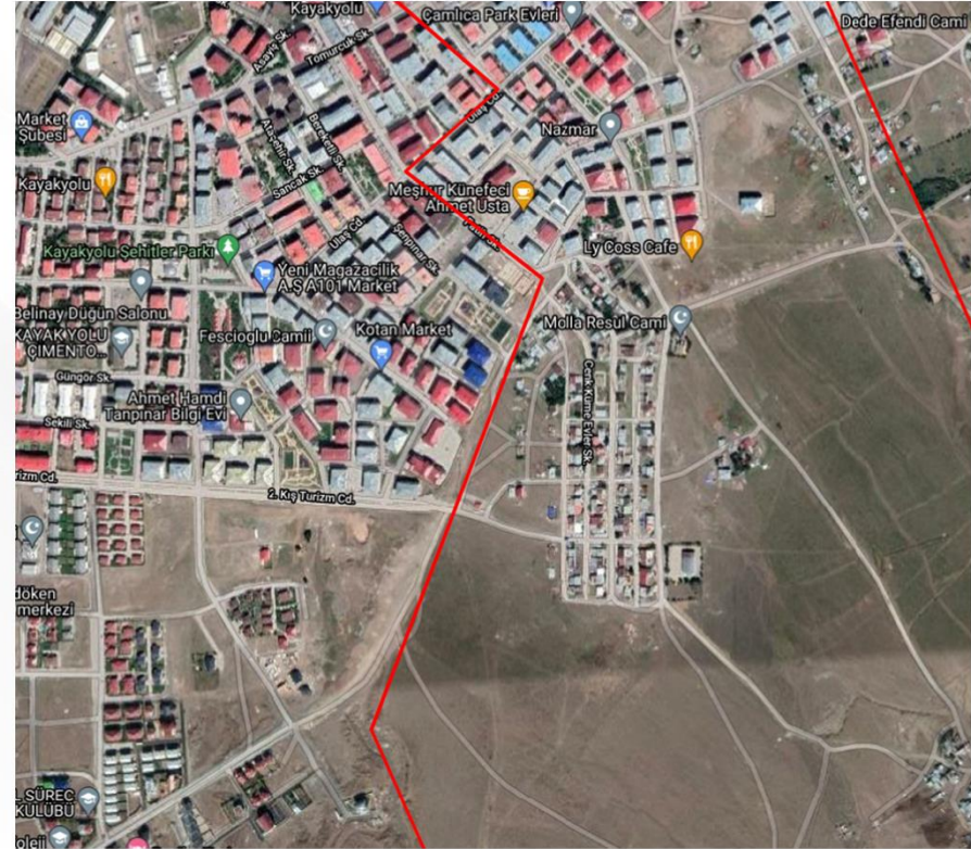
TKGM Parsel Görüntüsü