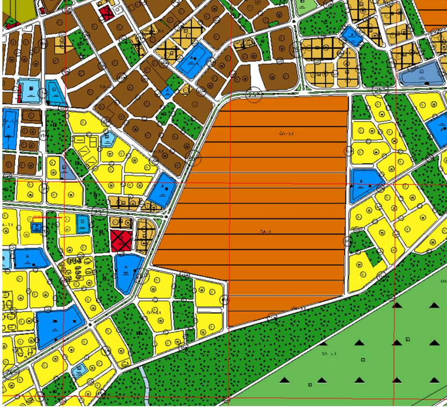
İmar Plan Değişiklik Öncesi Durum