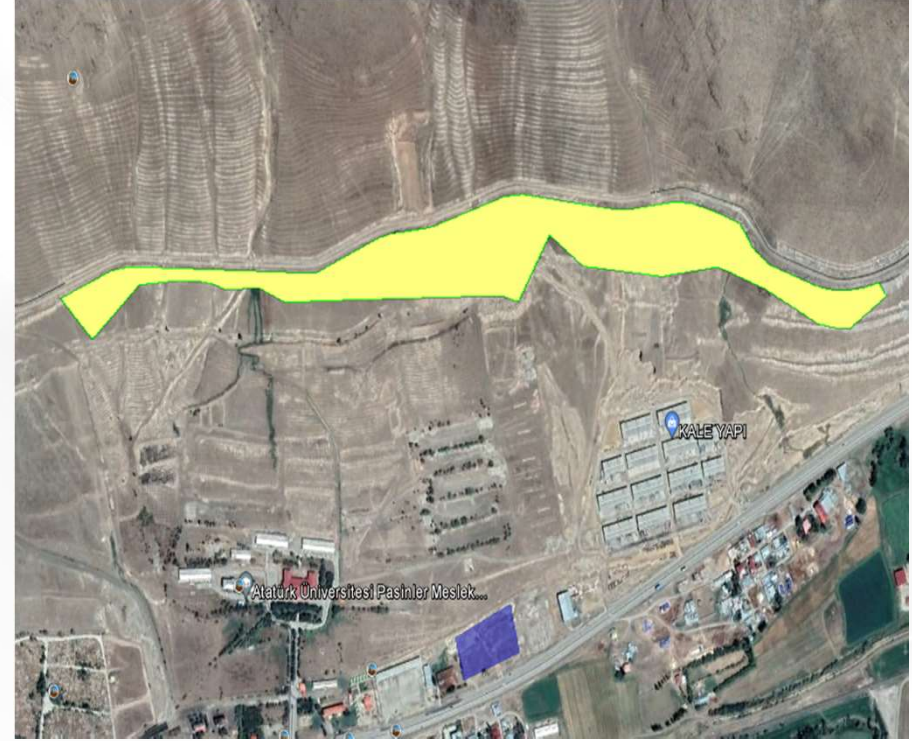
Alanın Yakın Uydu Görüntüsü