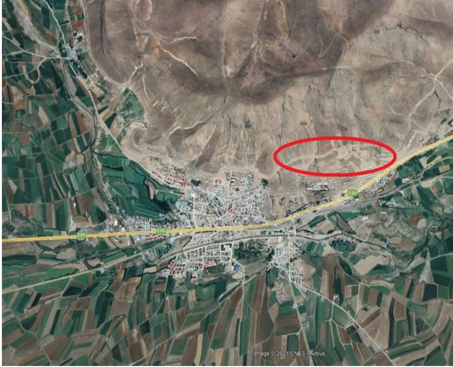
Alanın Uzak Uydu Görüntüsü