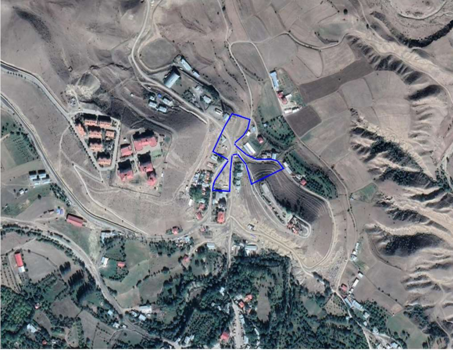
Alanın Uzak Uydu Görüntüsü