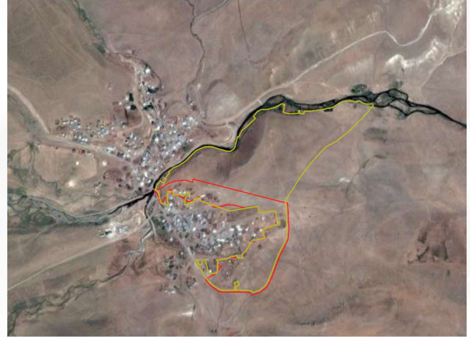
Alanın Yakın Uydu Görüntüsü