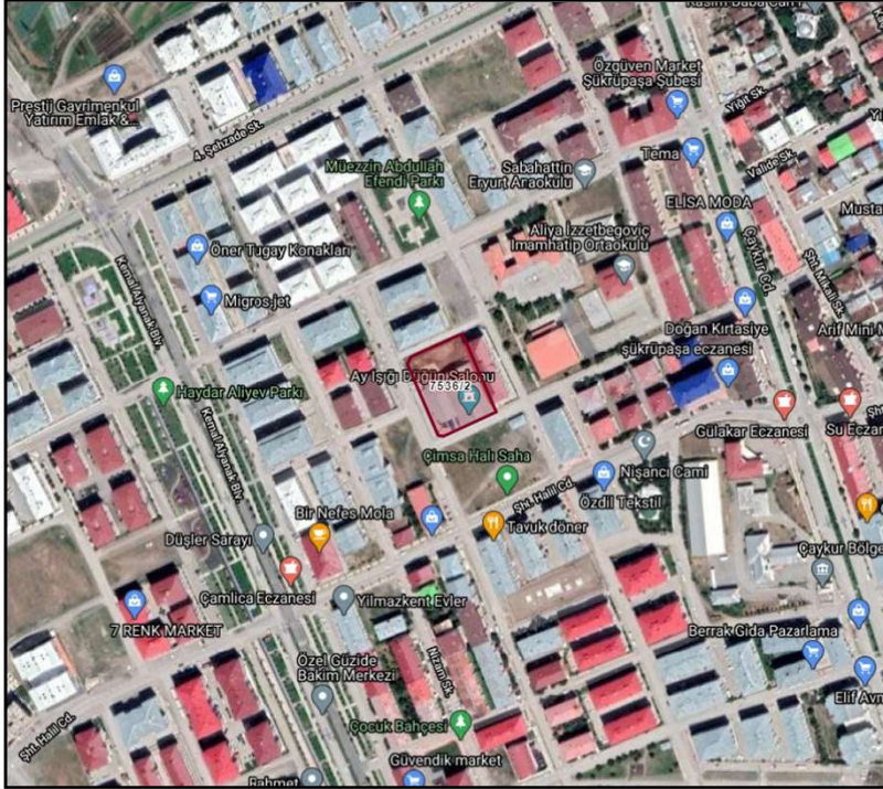
Alanın Uydu Görüntüsü

Yakutiye İlçesi, İstasyon Mahallesi 7536 ada 2 numaralı parsellerde kayıtlı taşınmaz meri imar planlarında Emsal: 1,20 Y ençok: 9,50 m yapılaşma koşulu ile Spor Alanında kalmakta olup bahse konu alanın Emsal: 1,20 Y ençok: 9,50 m yapılaşma koşulu ile Ticaret Alanı alanı olarak işlenmesi