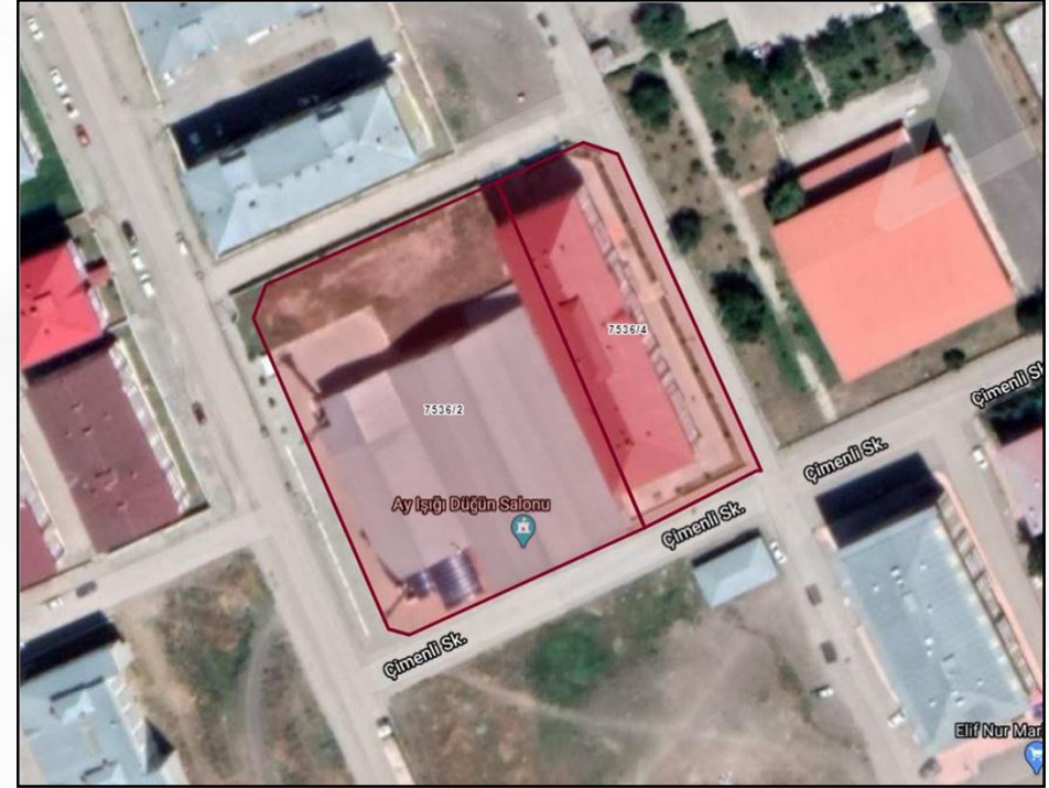
Alanın TKGM Parsel Uydu Görüntüsü