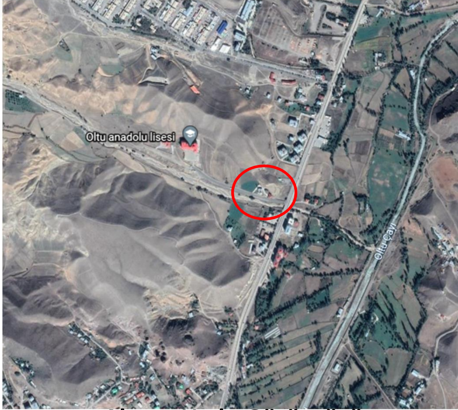
Alanın Uydu Görüntüsü

Oltu İlçesi, Şendurak Mahallesi, 564 ada 53 parselde kayıtlı taşınmaz üzerinde meri imar planlarında konut alanı olarak görünen alanın kuzeyinin ticaret+turizm alanı olarak işlenmesini içeren imar planı değişikliği