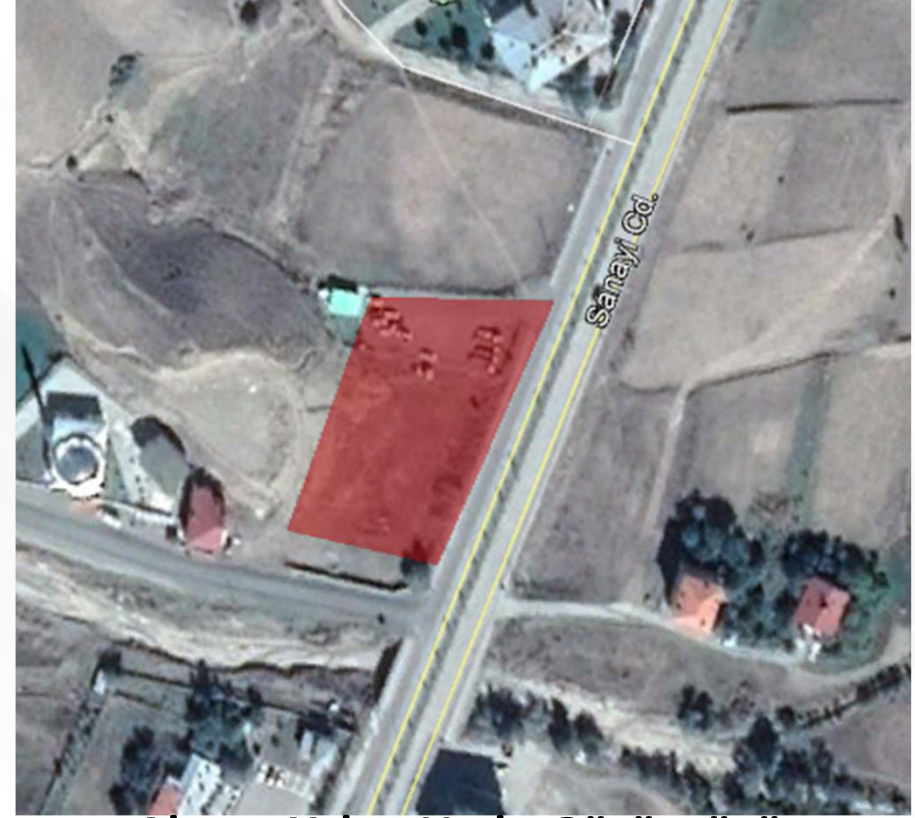
Alanın Yakın Uydu Görüntüsü