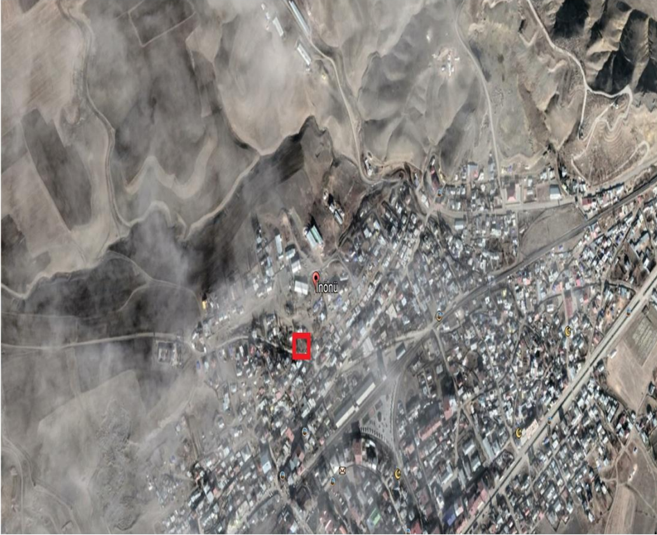
Alanın Uydu Görüntüsü

Horasan İlçesi İnönü Mahallesi, 287 ada, 31 nolu parselde kayıtlı taşınmazın Belediye Hizmet Alanı olarak işlenmesini içeren imar planı değişikliğini