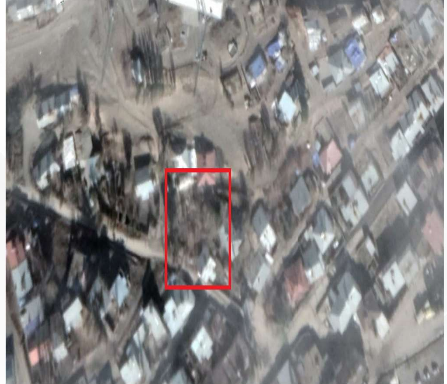
Alanın Yakın Uydu Görüntüsü