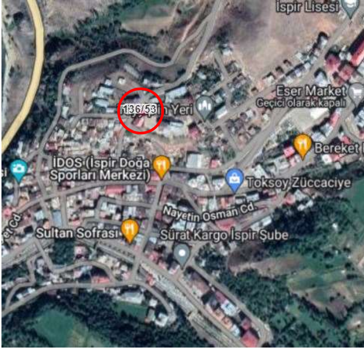
Alanın Uydu Görüntüsü (Uzak)

Erzurum İli, İspir İlçesi, Yukarı Mahalle 136 ada 53 numaralı parselde kayıtlı taşınmaz onaylı imar planında taşıt yolunun içinde kalması sebebiyle yolun yeniden düzenlenmesini içeren imar değişikliği