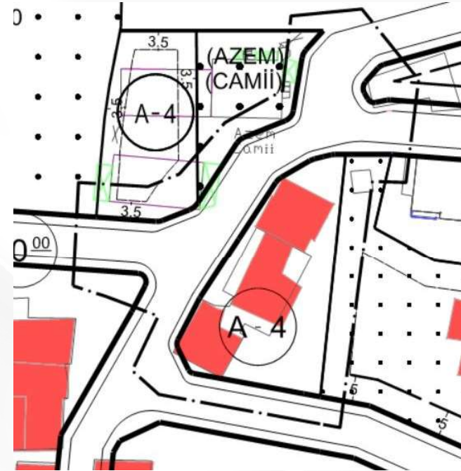
İmar Plan Değişiklik Sonrası Durum 1/1000 Uygulama İmar Planı