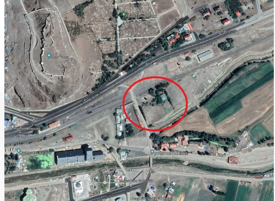
Alanın Yakın Uydu Görüntüsü