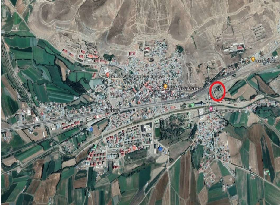
Alanın Uydu Görüntüsü