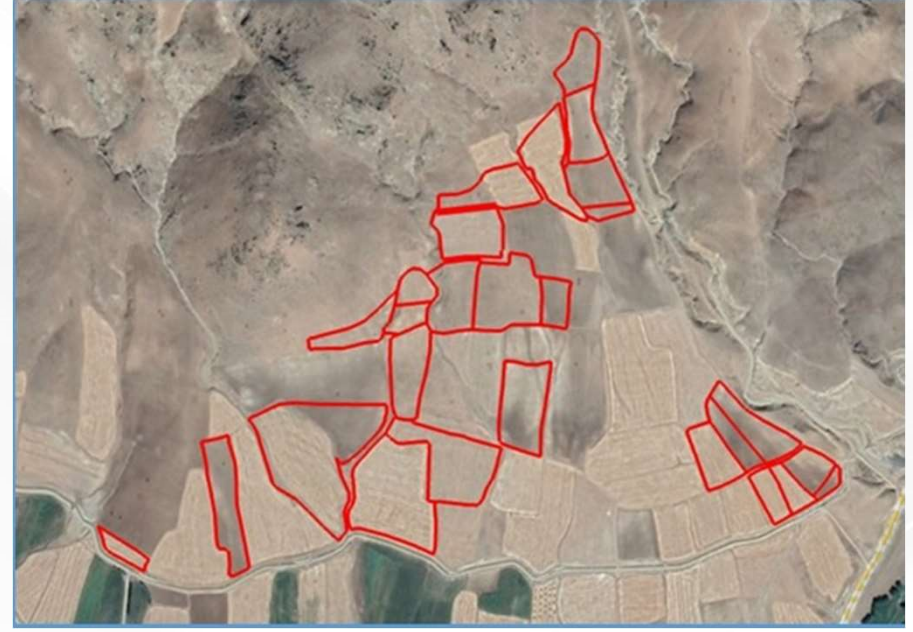
Alanın Yakın Uydu Görüntüsü (Yakın)