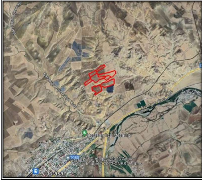
Alanın Uydu Görüntüsü (Uzak)

Erzurum İli Horasan İlçesi, Camiikebir Mahallesi 100 ada 2, 3, 4, 9, 10, 11, 13 ve 26 nolu parseller üzerinde Yenilenebilir Enerji Kaynaklarına Dayalı Üretim Tesis Alanı yapılmasını içeren imar planı.