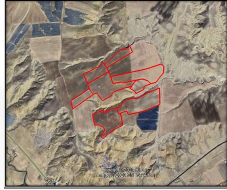
Alanın Uydu Görüntüsü (Yakın)