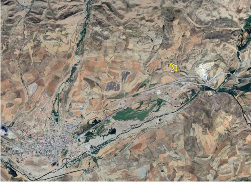
Alanın Uydu Görüntüsü