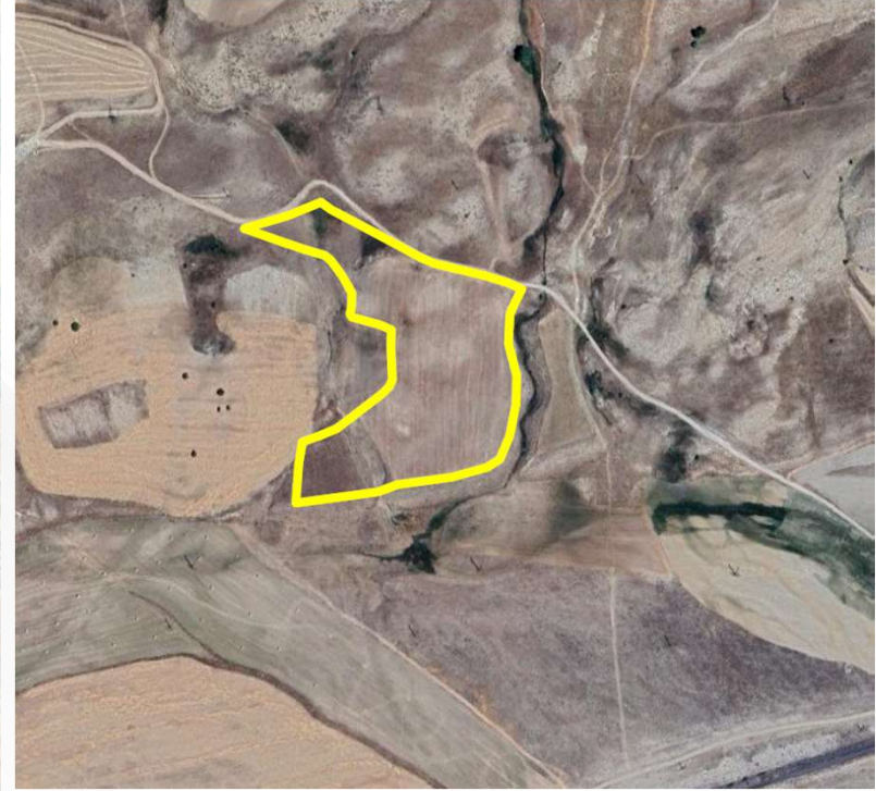
Alanın Yakın Uydu Görüntüsü