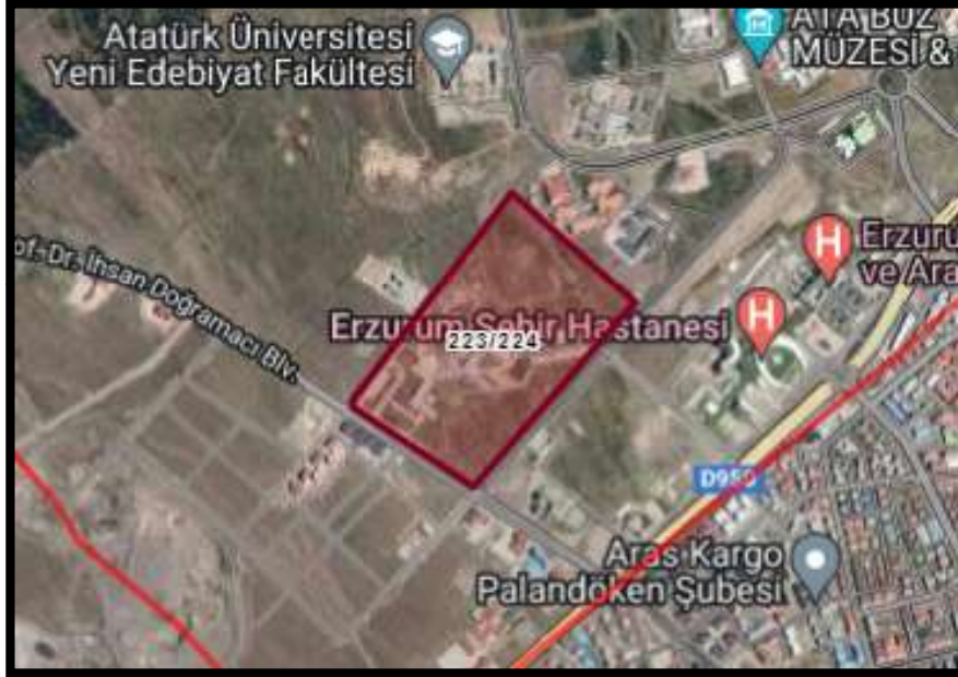
Alanın Uydu Görüntüsü (Uzak)

Yakutiye İlçe Belediye Meclisinin 02.10.2023 Tarih ve 82 Sayılı Kararı ile kabul edilen: Erzurum İli, Yakutiye İlçesi, Muratpaşa Mahallesi, 223 ada, 224 nolu parselde kayıtlı meri planlarında Üniversite Alanı olarak görülen taşınmazın Emsal: 1.00 Yençok: 6.50 m. Yenilenebilir Enerji Kaynaklarına Dayalı Üretim Tesis Alanı olarak işlenmesini içeren imar plan değişikliğinin, 5216 sayılı Büyükşehir Belediyesi kanununun 14. maddesine istinaden görüşülerek bir karara bağlanması hususu.