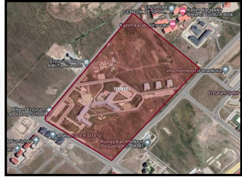
Alanın Uydu Görüntüsü (Yakın)