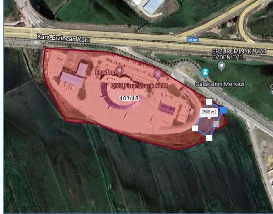
Emlak Dairesinin Talep Ettiği Alanı