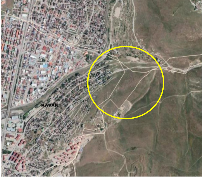
Alanın Uydu Görüntüsü (Uzak)

Erzurum Su Kanalizasyon İdaresinin talebi üzerine Yakutiye İlçesi Tepe Mezarlık, Hilalkent ve Şükrüpaşa İçme Suyu Depo ve Deplase Hatları Yapımı için Yakutiye İlçesi, Kavak Mahallesi 14241 ada 1 numaralı parselin doğusunda yer alan, onaylı imar planlarında Cami ve Kreş Alanı olarak görünen alanın Teknik Altyapı Alanı olarak işlenmesini içeren imar planı değişikliğinin