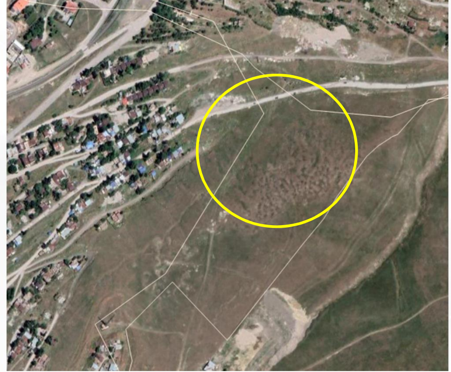
Alanın Uydu Görüntüsü (Yakın)