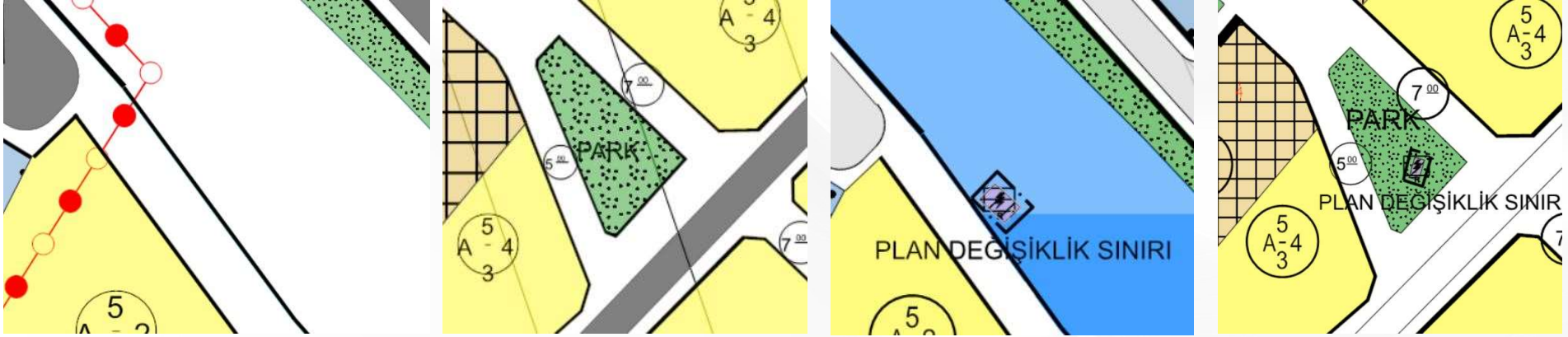
İmar Plan Değişiklik Öncesi Durum 1/1000 Uygulama İmar Planı