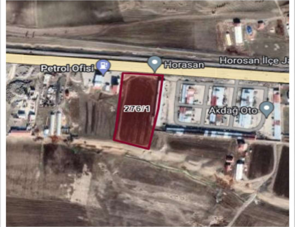
Alanın Uydu Görüntüsü (Yakın)