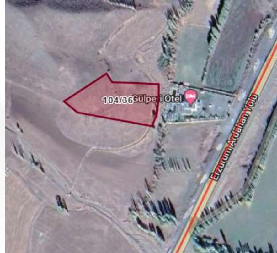
Alanın Yakın Uydu Görüntüsü