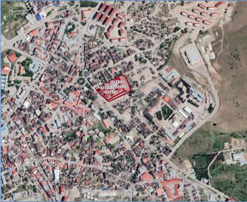
Alanın Uydu Görüntüsü

Abdurrahmanağa Mahallesi 11457 Ada 3, 4, 5, 6 ve 18 numaralı parsellerin bulunduğu alan onaylı imar planlarında 7 kat kitle işlemeli TİCK ve Konut Alanı olarak görünmekte olup söz konusu alanın Erzurum İl Jandarma Komutanlığının ilgi yazısı doğrultusunda aynı yapılaşma koşullarıyla Resmi Kurum Alanı (Jandarma) olarak işlenmesi hususunun görüşülmesi