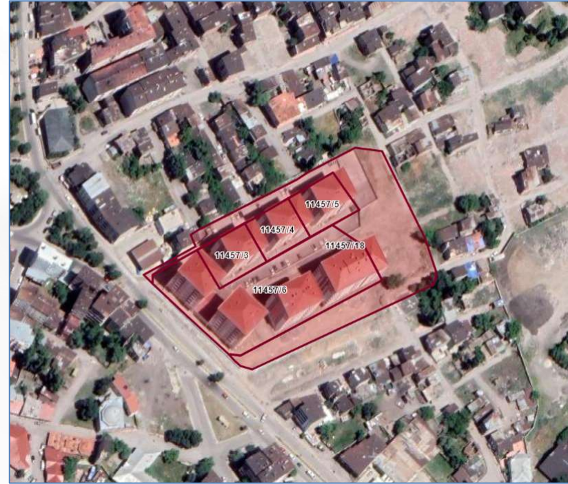
Alanın Yakın Uydu Görüntüsü