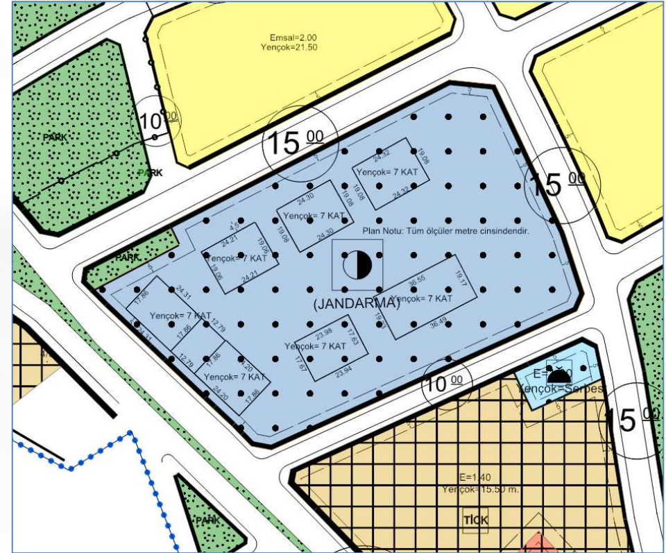
İmar Plan Değişiklik Sonrası Durum