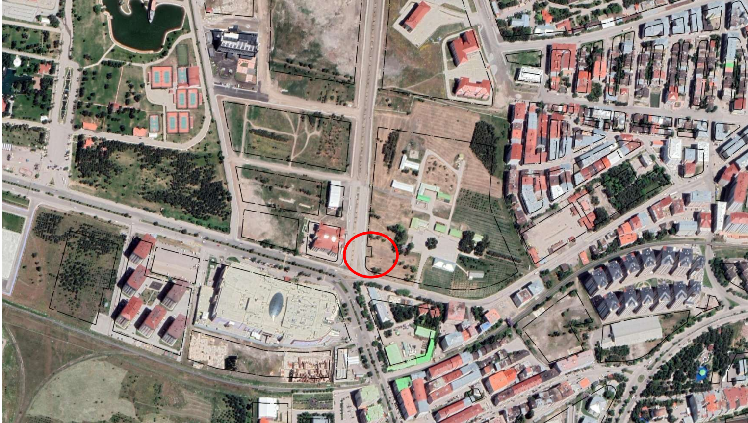
Alanın Uydu Görüntüsü

Ulaşım Daire Başkanlığının talebi üzerine; Yakutiye İlçesi Terminal Caddesi ile Farabi Caddesi kesişim noktasına (MNG AVM Kavşağına) yeni trafiğe açılan Abdürrahim Şerif Beygu Caddesi'nin bağlanmasını içeren kavşak projenin uygulanması için MNG AVM kavşağı girişinde bulunan TEDAŞ'a ait Trafo Köşkünün taşınması ve kavşak projesinin imar planına işlenmesi hususu