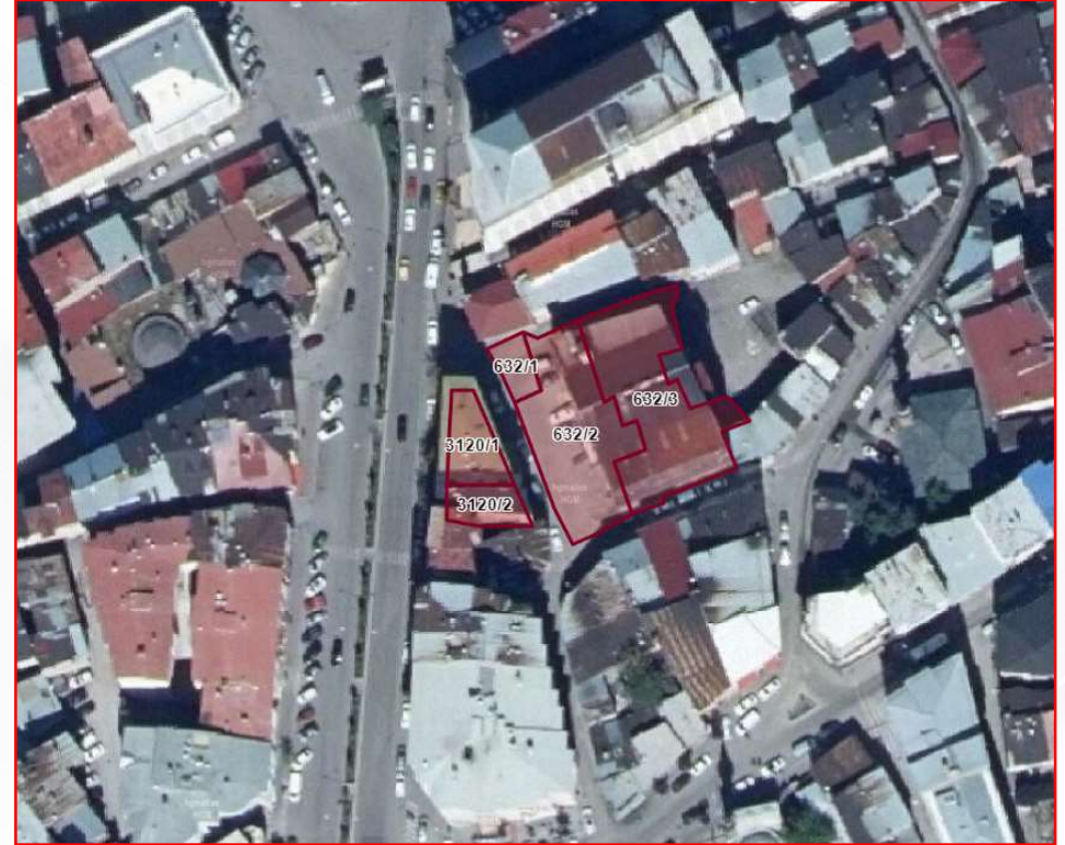
Alanın Uydu Görüntüsü (Yakın)