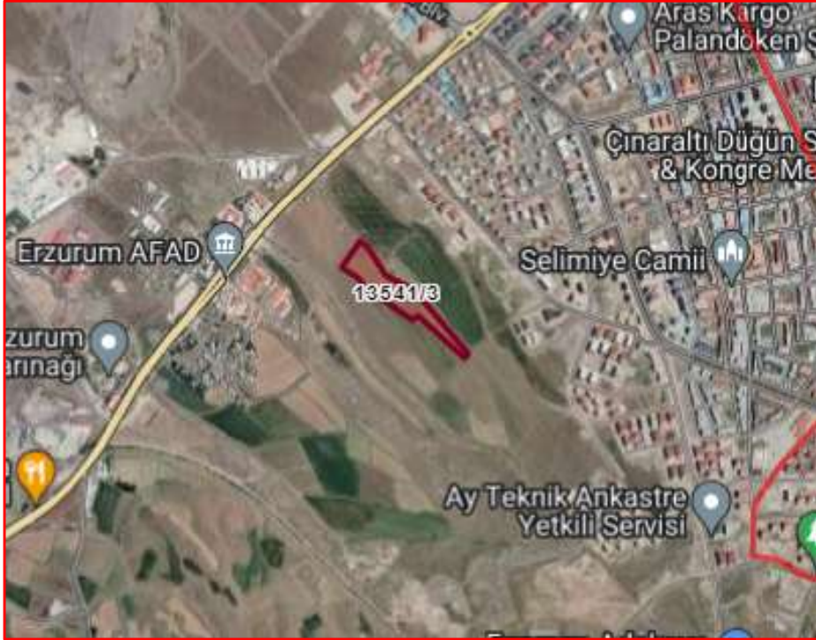
Alanın Uydu Görüntüsü (Uzak)