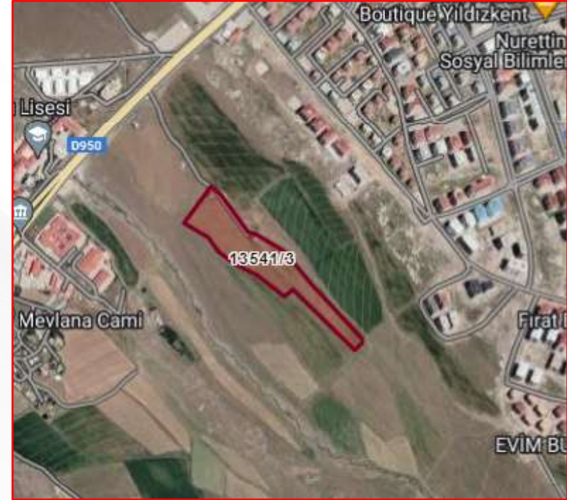
Alanın Uydu Görüntüsü (Yakın)