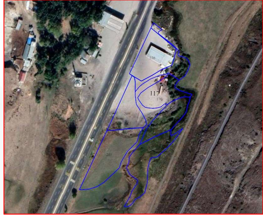
Alanın Yakın Uydu Görüntüsü