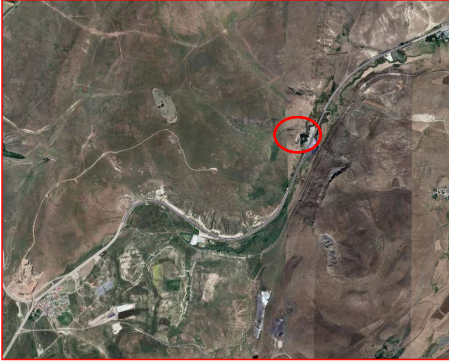
Alanın Uydu Görüntüsü

Pasinler İlçesi Büyüktuy mahallesi 117 ada 170, 209 ve 237 nolu parsellerde kayıtlı taşınmazların Akaryakıt Servis İstasyon Alanı işlenmesini içeren imar plan değişikliğinin görüşülmesi