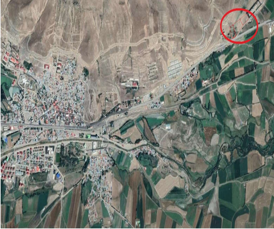
Alanın Uydu Görüntüsü (Uzak)