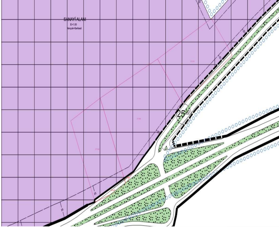
İmar Plan Değişiklik Öncesi Durum 1/1000 Uygulama İmar Planı