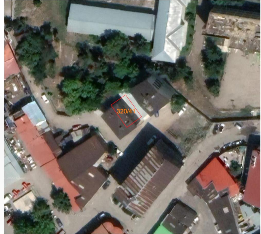
Alanın Yakın Uydur Görüntüsü