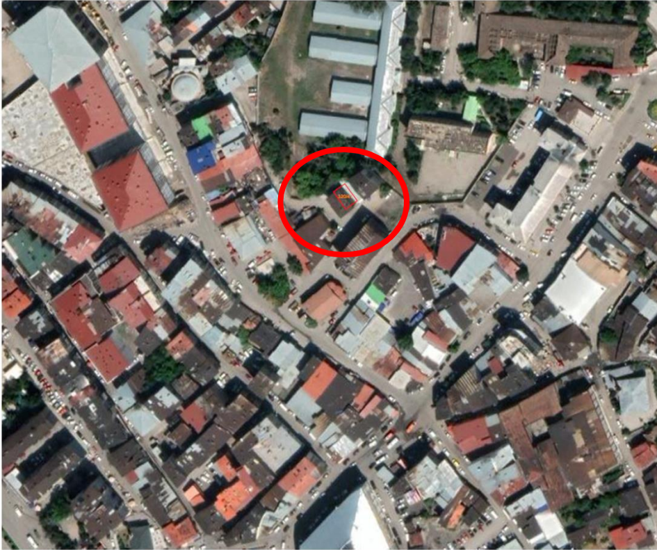
Alanın Uzak Uydur Görüntüsü

Yakutiye İlçesi Alipaşa Mahallesi, kadastronun 320 Ada 41 nolu parselde kayıtlı taşınmazın h=12 metreden h=15 metreye çıkarılmasını içeren imar planı değişikliği