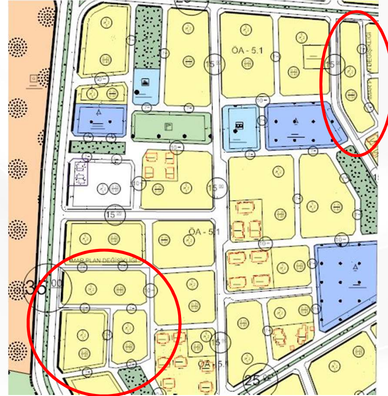
İmar Plan Değişiklik Sonrası Durum