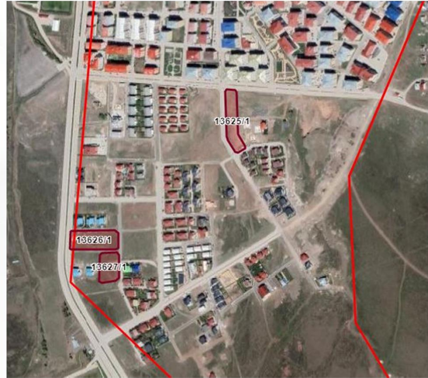
Alanın TKGM Görüntüsü