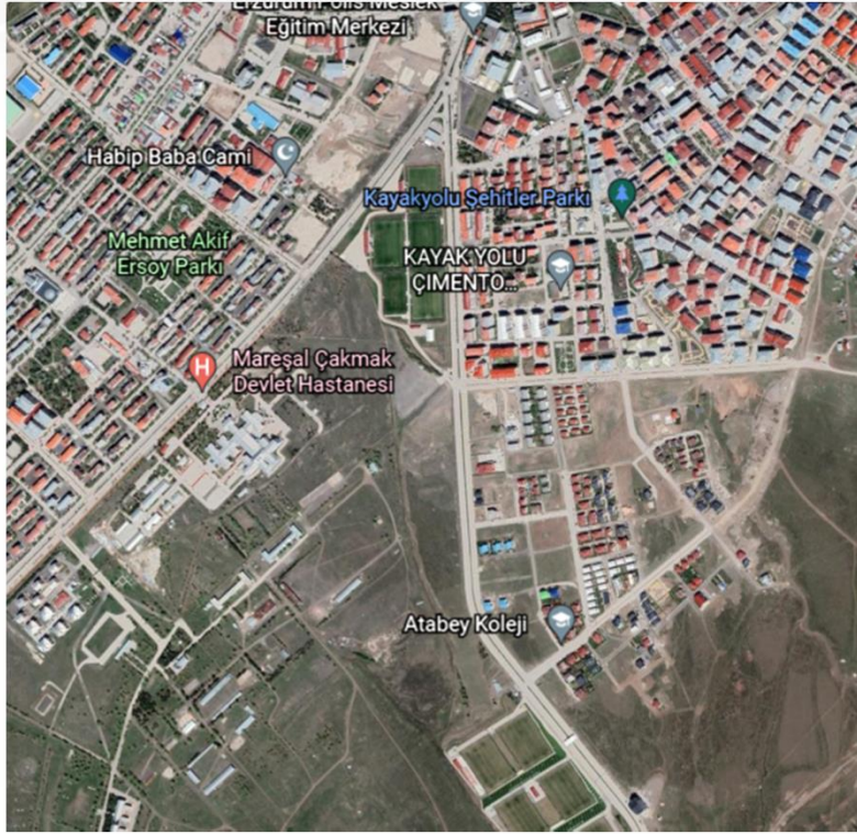
Alanın Uydu Görüntüsü