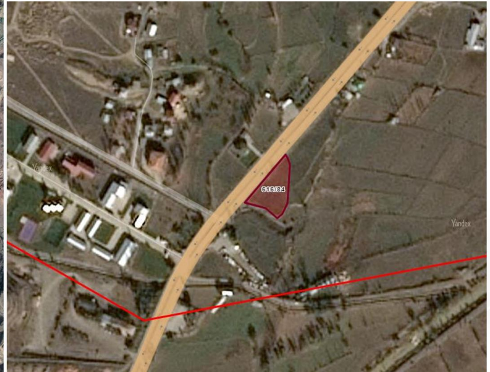
Alanın TKGM Görüntüsü