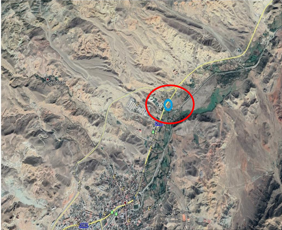
Alanın Uydu Görüntüsü