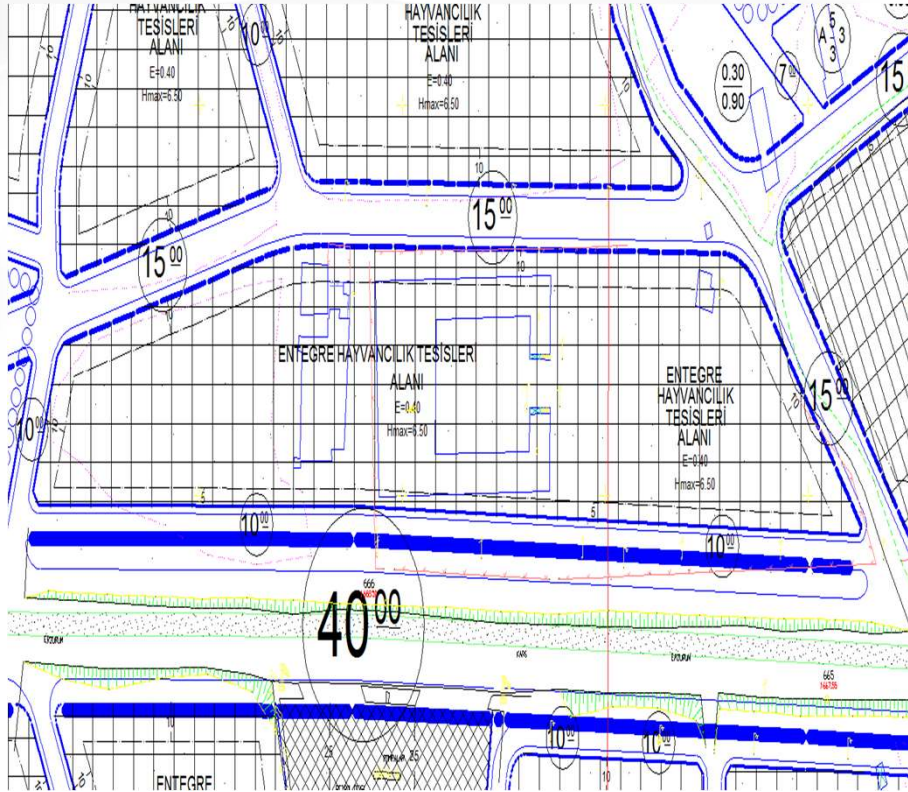
İmar Plan Değişiklik Öncesi Durum 1/1000 Uygulama İmar Planı