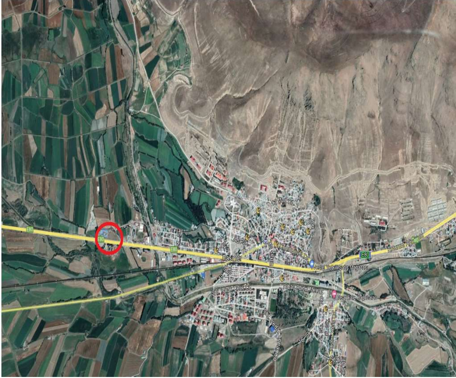
Alanın Uydu Görüntüsü (Uzak)