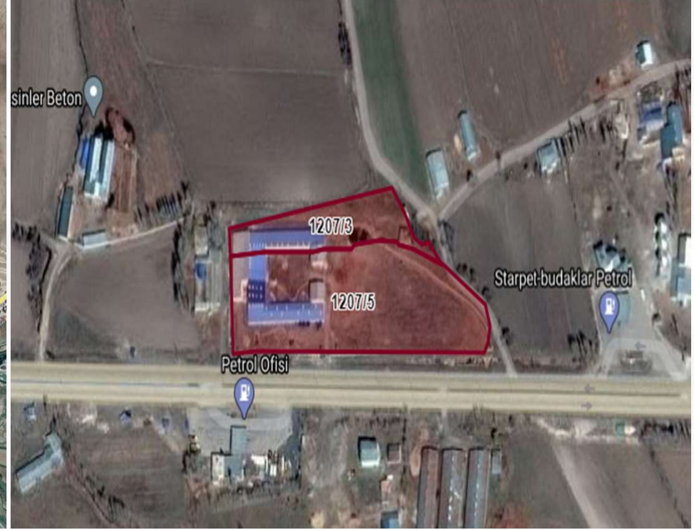
Alanın Uydu Görüntüsü (Yakın)