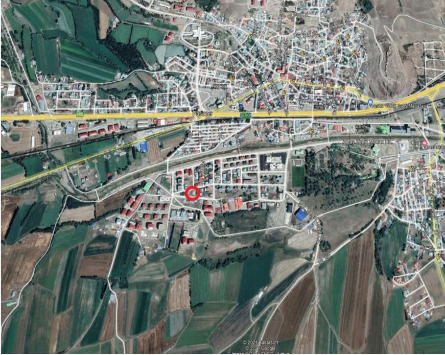
Alanın Uydu Görüntüsü (Uzak)