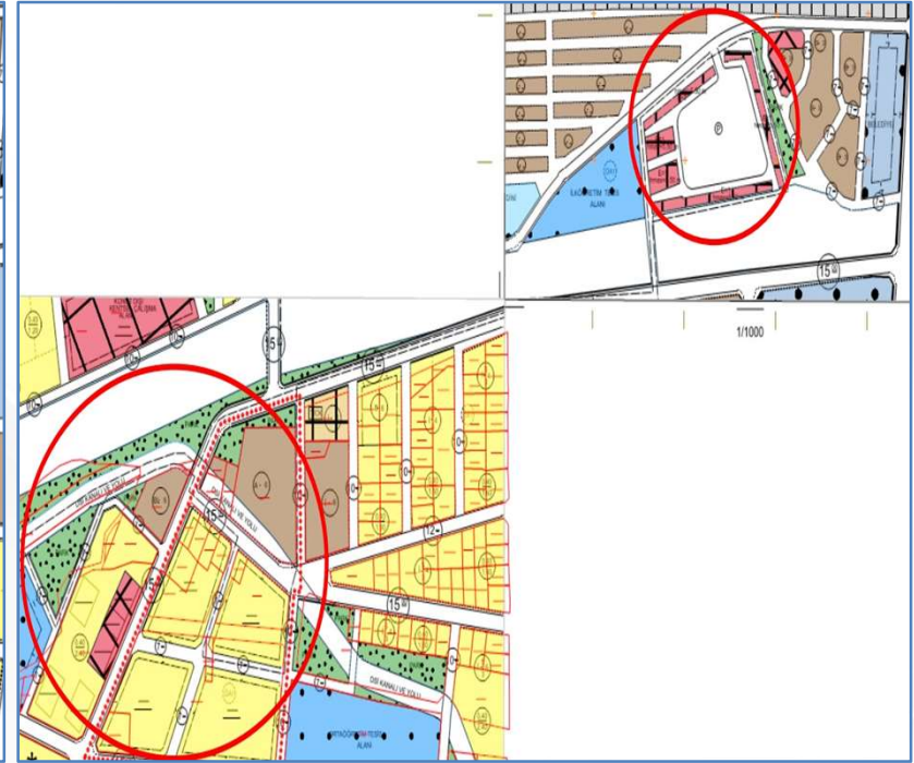
İmar Plan Değişiklik Sonrası Durum 1/1000 Uygulama İmar Planı