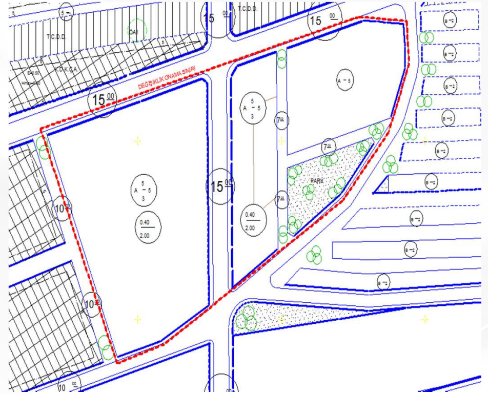
İmar Plan Değişiklik Sonrası Durum 1/1000 Uygulama İmar Planı