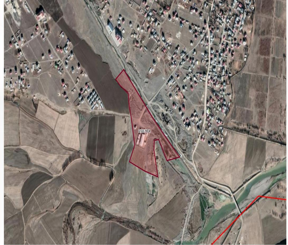
Alanın Uydu Görüntüsü (Yakın)