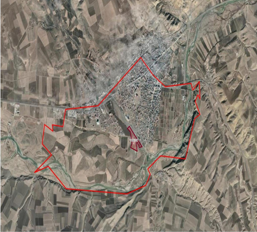
Alanın Uydu Görüntüsü (Uzak)