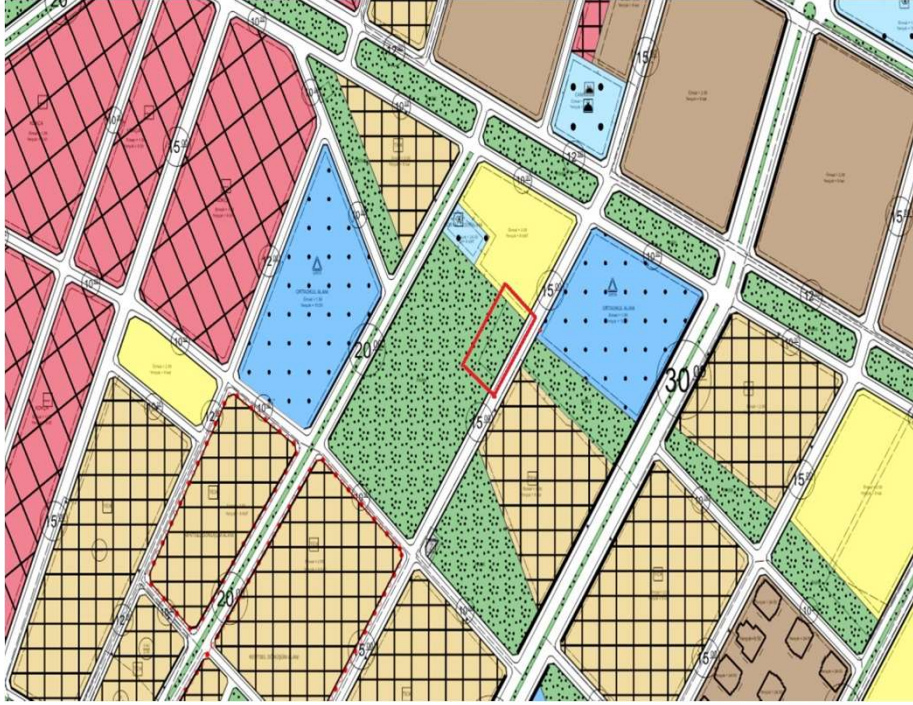
İmar Plan Değişiklik Öncesi Durum 1/1000 Uygulama İmar Planı