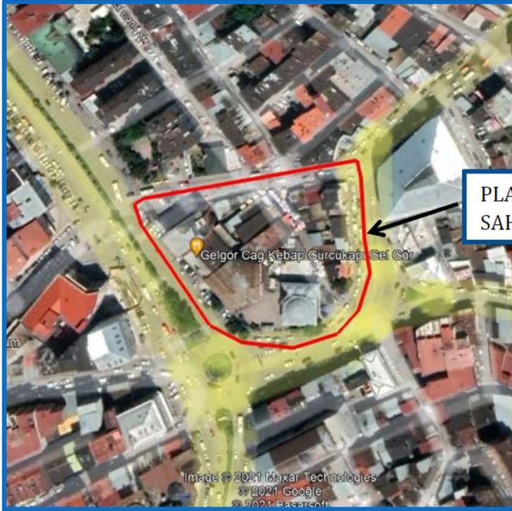
Alanın Uydu Görüntüsü