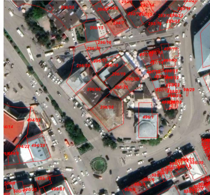
Alanın TKGM Görüntüsü