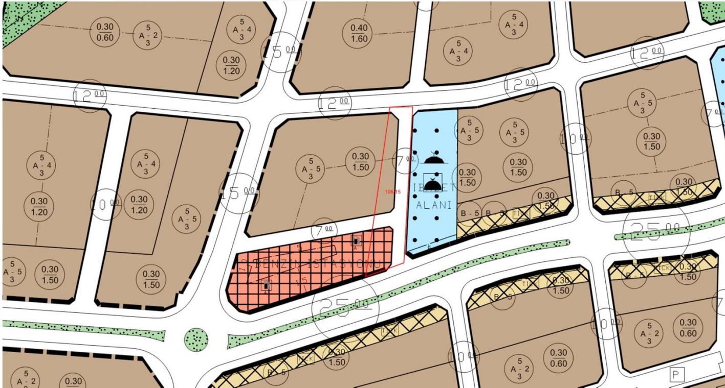
1/1000 Uygulama İmar Planı