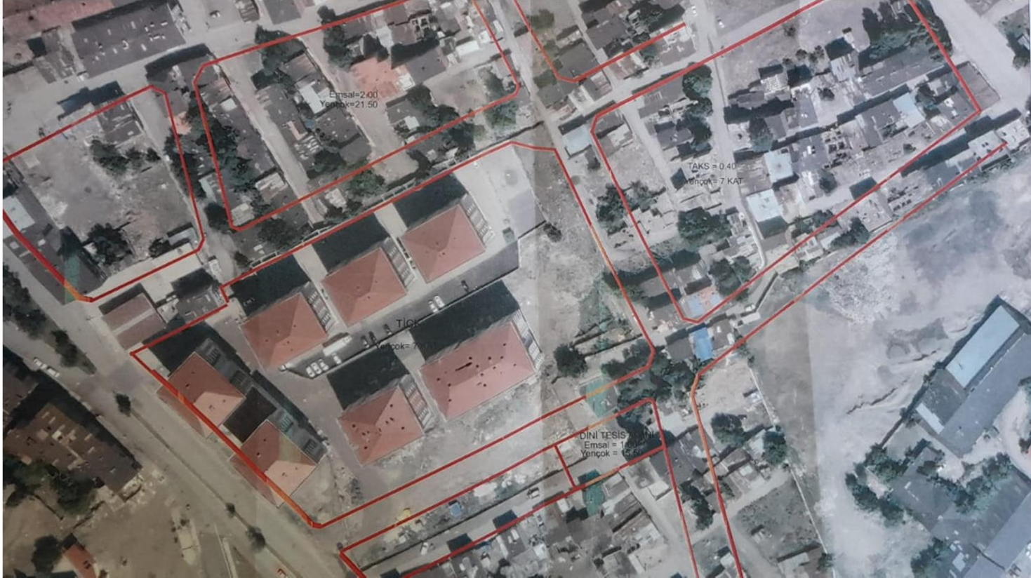
Alanın Uydu Görüntüsü