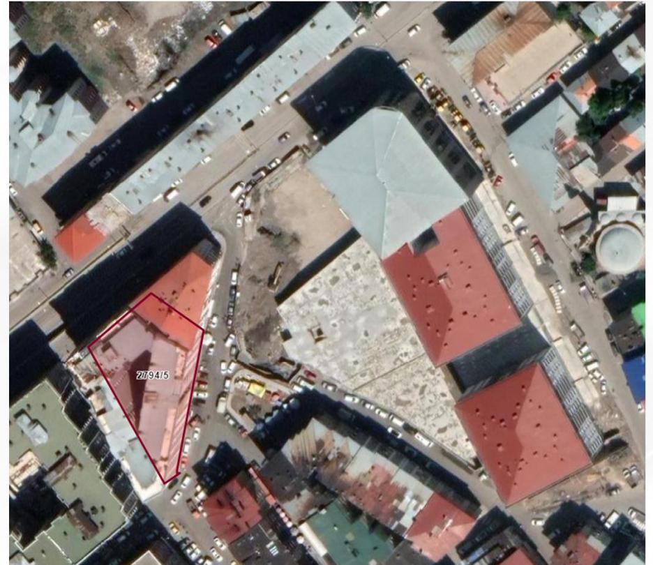
Alanın TKGM Görüntüsü