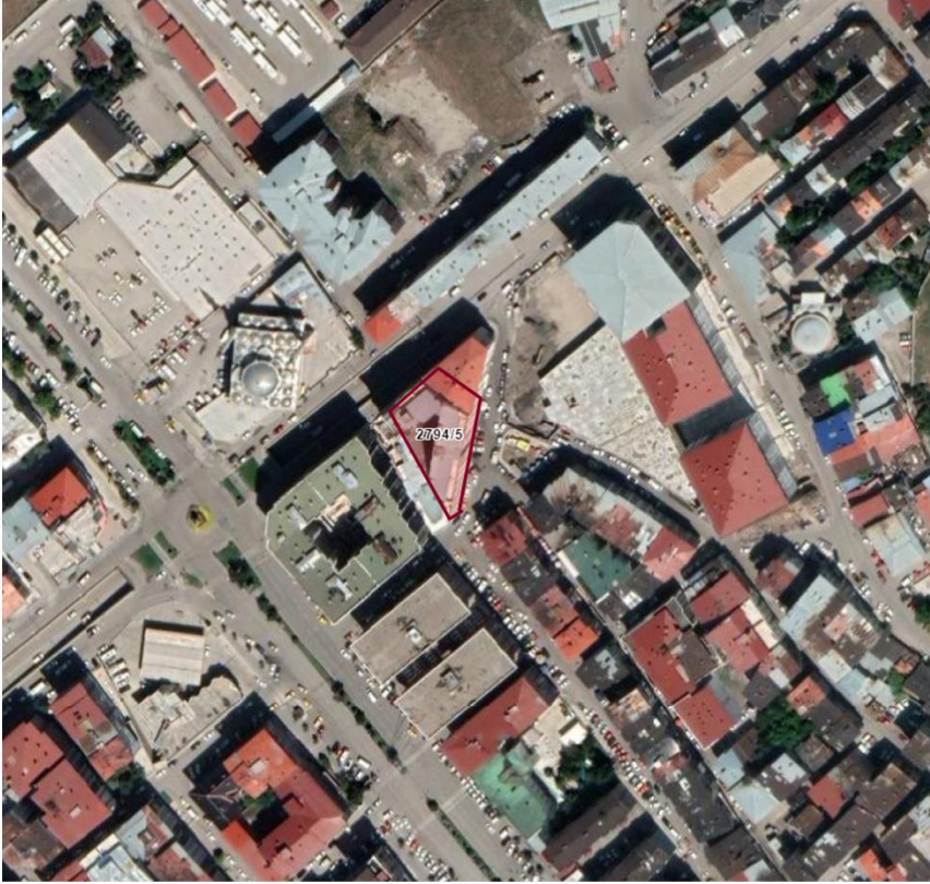
Alanın Uydu Görüntüsü