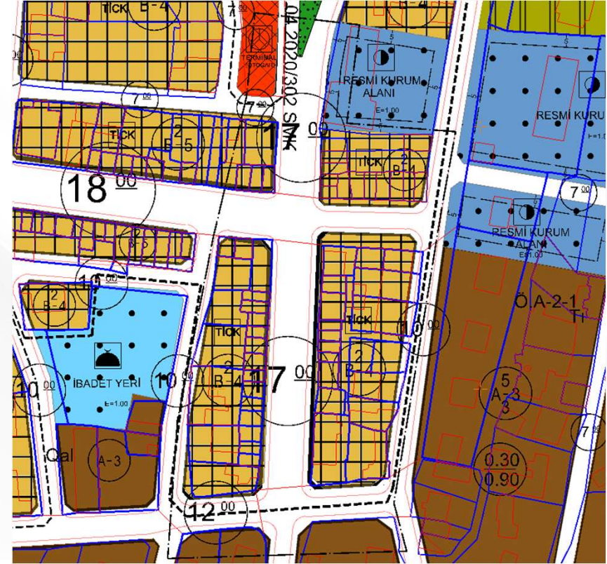
İmar Plan Değişiklik Sonrası Durum 1/1000 Uygulama İmar Planı