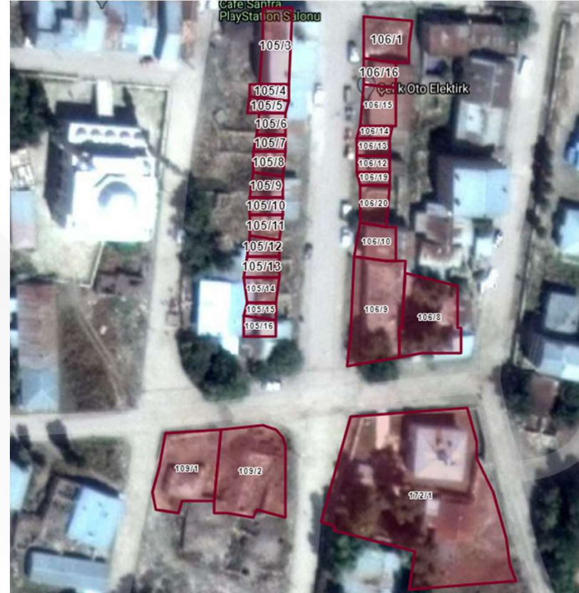
Alanın Yakın Uydu Görüntüsü