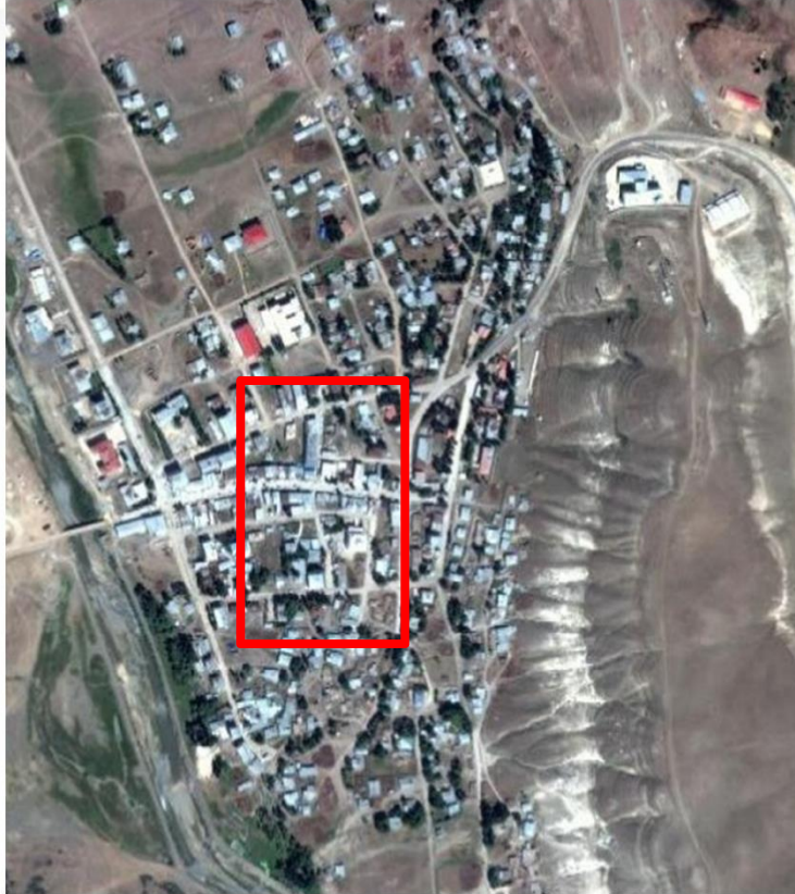
Alanın Uzak Uydu Görüntüsü

Tekman İlçesi, İsmet Paşa Mahallesi 105 ada 3, 4, 5, 6, 7, 8, 9, 10, 11, 12, 13, 14, 15, 16 numaralı parsellerde yapılan imar planı değişikliği.