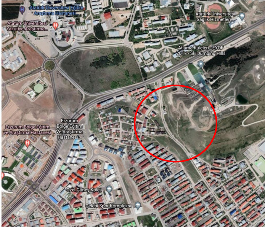
Alanın Uydu Görüntüsü