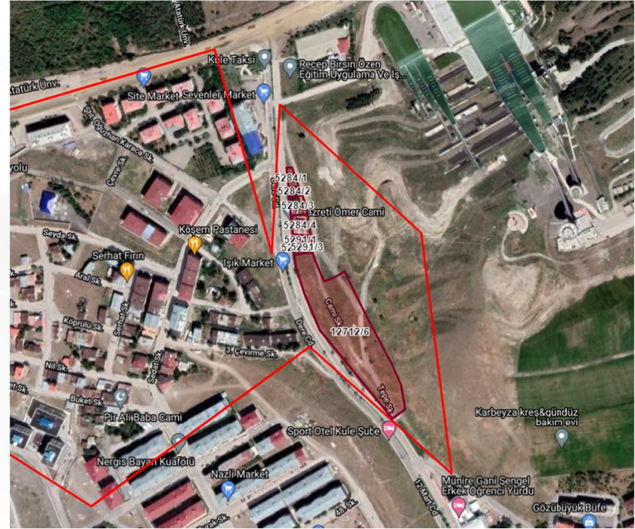
TKGM Parsel Görüntüsü