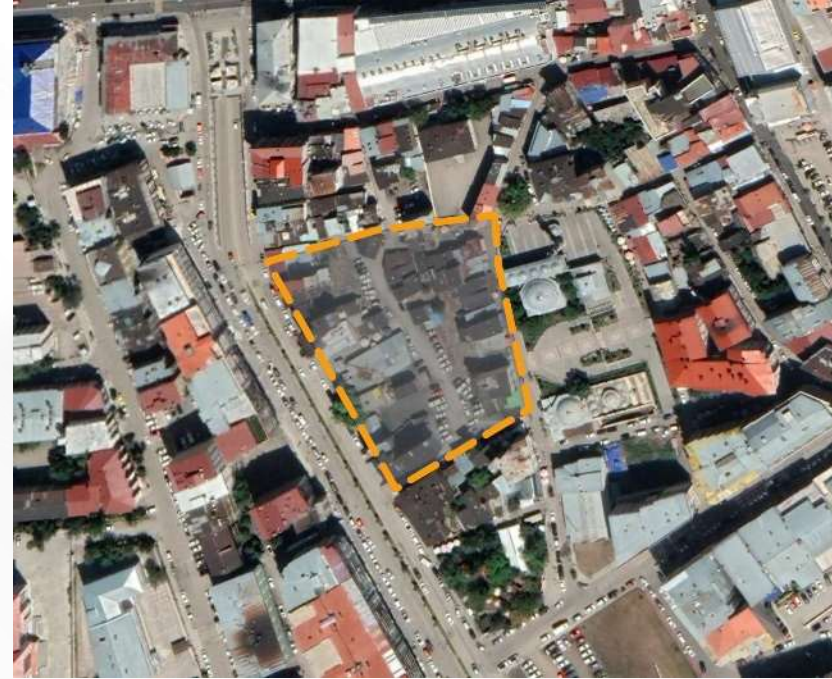
Alanın Yakın Uydu Görüntüsü