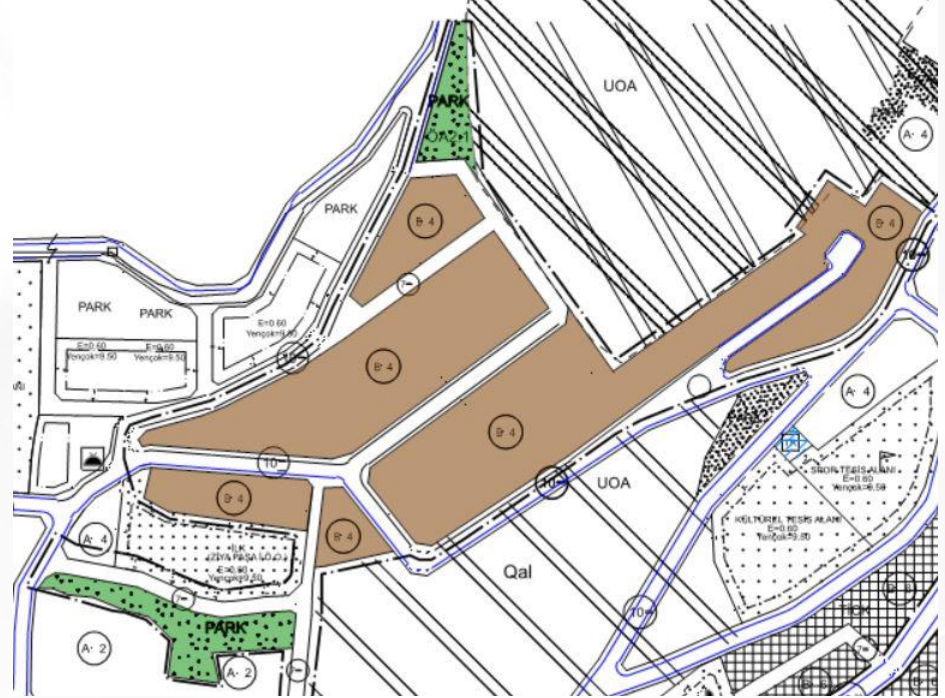
İmar Plan Değişiklik Sonrası Durum 1/1000 Uygulama İmar Planı