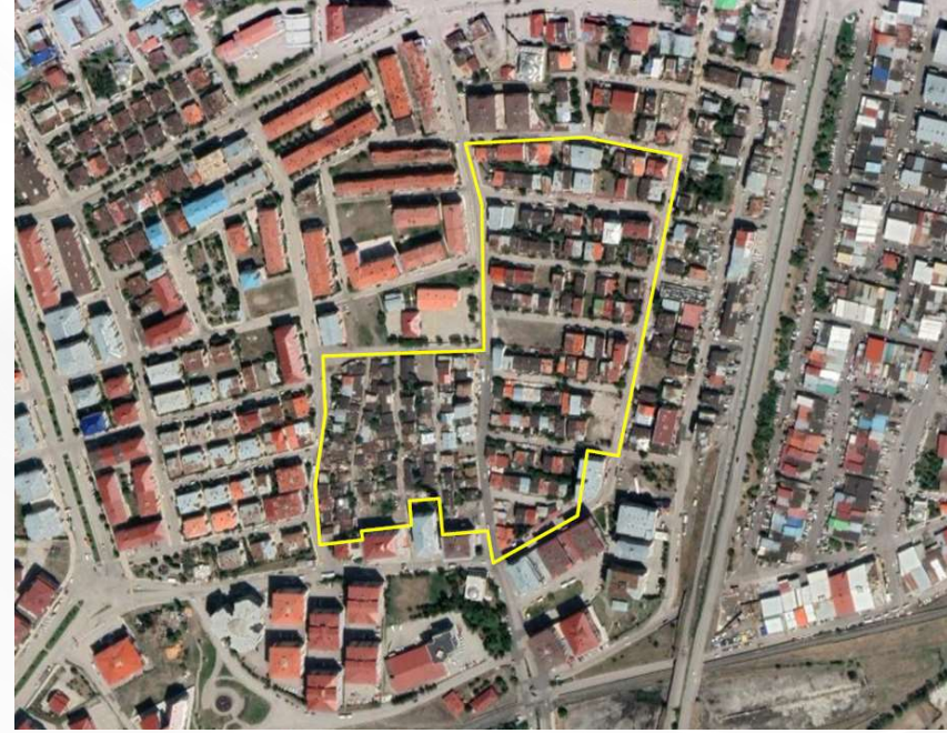
Alanın Uydu Görüntüsü (Yakın)