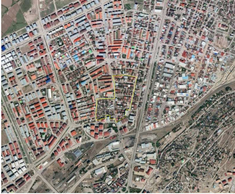
Alanın Uydu Görüntüsü (Uzak)