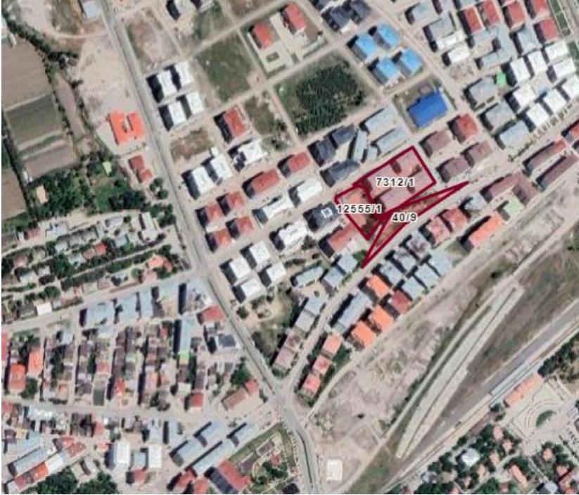
Alanın Uydu Görüntüsü (Uzak)

Yakutiye İlçesi, İstasyon Mahallesi, 12555 ada 1 parsel ve 40 ada 9 numaralı parselde kayıtlı taşınmaz onaylı imar planında konut+ticaret alanı olarak görünmekte olup söz konusu alanın 1113 m 2 'lik kısmının Emsal: 1.00, Y ençok: 9.50 m yapılaşma koşuluyla Ticaret Alanı olarak işlenmesi, 2466 m 2 'lik kısmının park alanı olarak işlenmesini içeren imar planı değişikliği