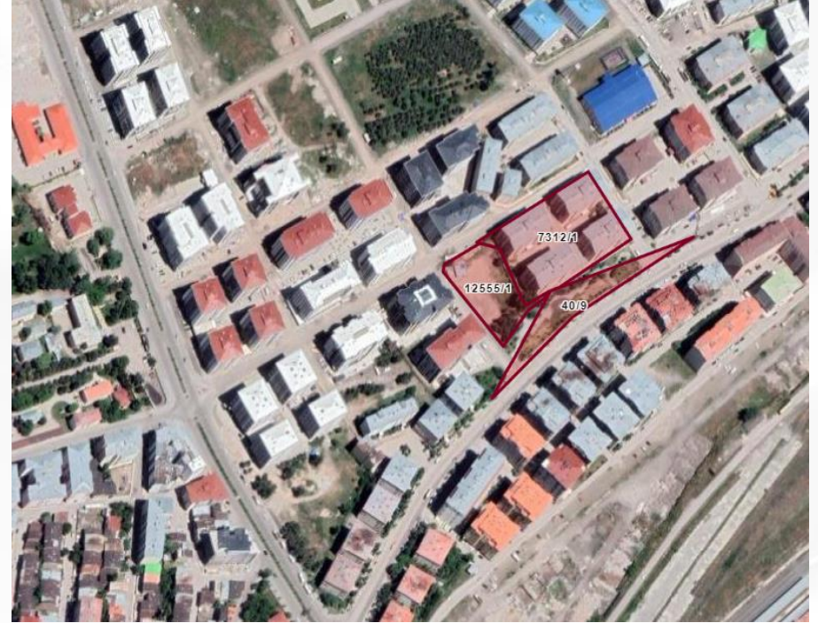
Alanın Uydu Görüntüsü (Yakın)