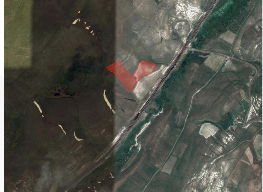
Alanın Uydu Görüntüsü (Yakın)