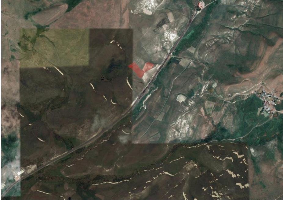
Alanın Uydu Görüntüsü (Uzak)

Erzurum İli, Yakutiye İlçesi, Güzelyayla Mahallesi 118 ada 74 ve 76 numaralı parsellerde bulunan taşınmazın Emsal:0.50 Hmx:6.50 m yapılaşma koşulları ile Yenilenebilir Enerji Kaynaklarına Dayalı Üretim Tesis Alanı (GES) olarak işlenmesini içeren mevzi imar planı hususunun görüşülmesi.