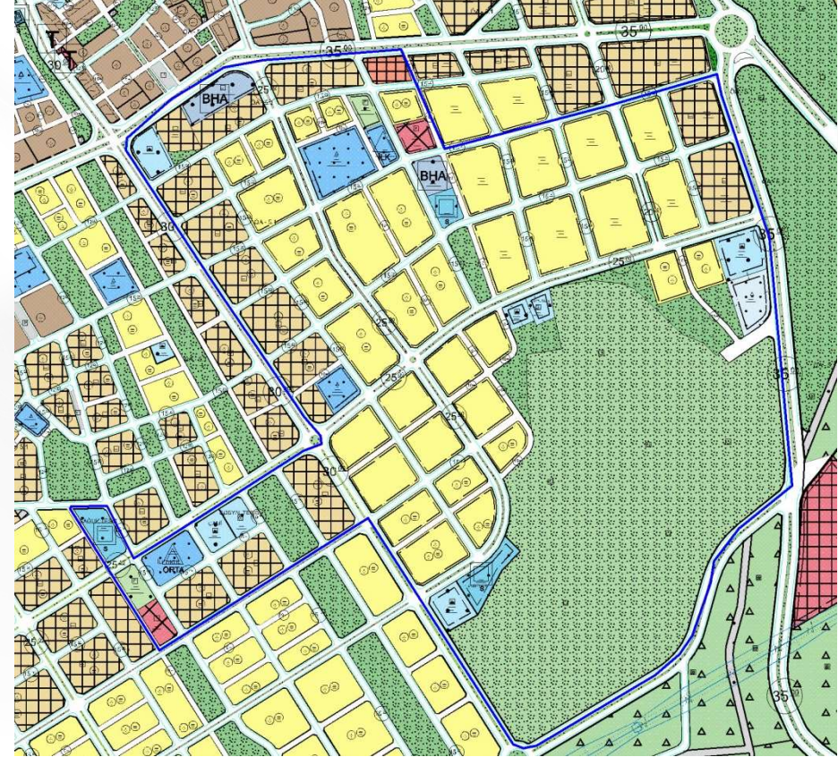
İmar Plan Değişiklik Sonrası Durum