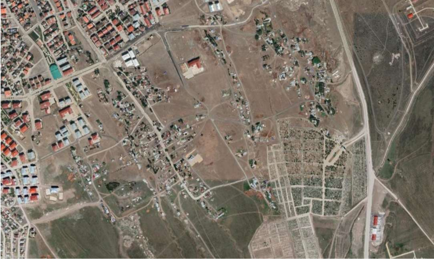
Alanın Uydu Görüntüsü

Kazımyurdalan Mahallesi 164 ada 13 numaralı parsel Mezarlık Alanına tekabül etmekte olup, söz konusu bölgede kamu yararına yapılacak imar uygulaması için DOP miktarı yüzde 45'in üzerine çıkmakta ve bu duruma istinaden söz konusu bölgede yüksek maliyetli kamulaştırma işlemi gerekmekte olup, kamu yararı göz önünde bulundurularak 1/1000 ölçekli Uygulama İmar Planının revizyon edilmesi