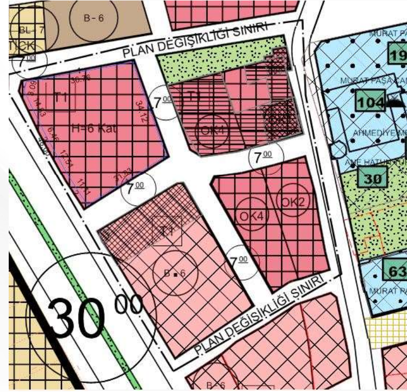
İmar Plan Değişiklik Sonrası Durum