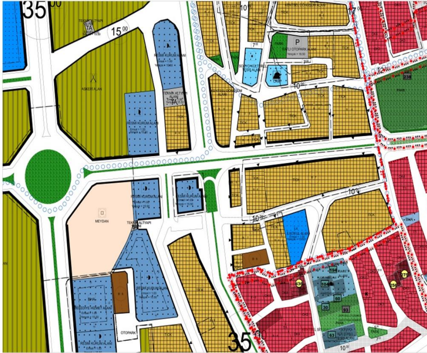
İmar Plan Değişiklik Öncesi Durum